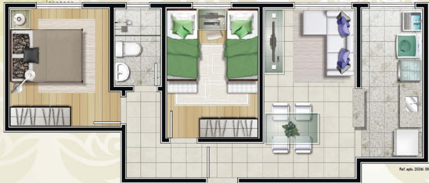
Ref. apto. 203/bl. 09