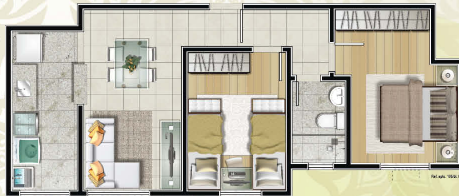
Ref. apto. 106/bl. 09

ESPALHE CONFORTO E BEM-ESTAR POR TODOS OS ESPAÇOS.