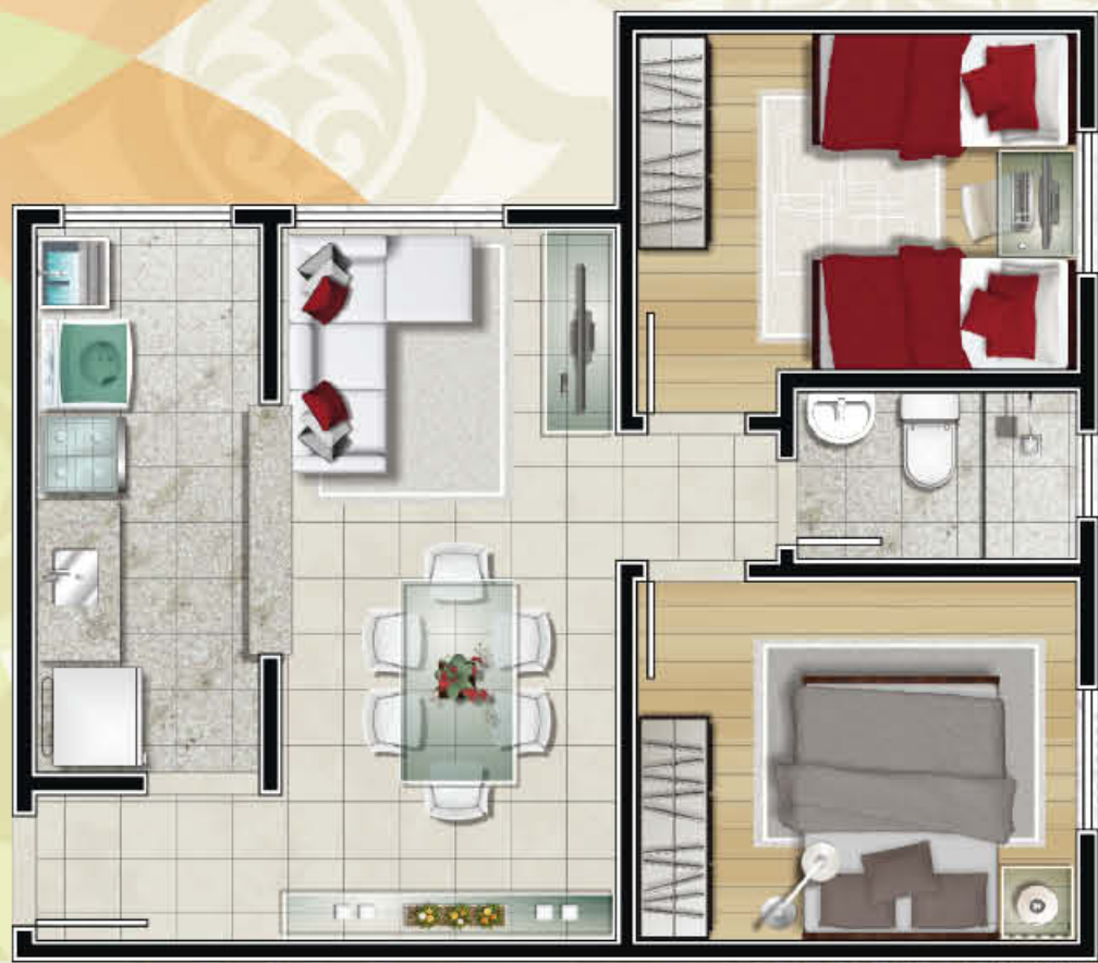
Ref. apto. 201/bl. 09